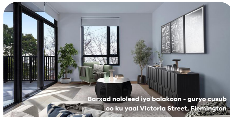
Barxad nololeed iyo balakoon - guryo cusub oo ku yaal Victoria Street, Flemington