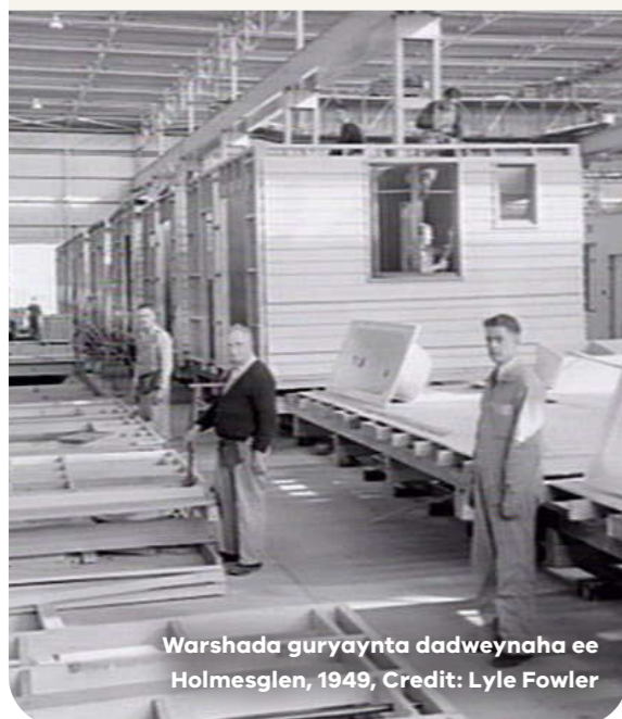
Warshada guryaynta dadweynaha ee Holmesglen, 1949, Credit: Lyle Fowler

Dabaqyadeena dhaadheer waxay taagnaayeen ku dhawaad 70 sano, laakiin hadda waxay ku dhowdahay dhammaadka noloshooda shaqo. 44-ta dabaq waxaa lagu dhisay heerar duugoobay oo ah raaxada kulaylka, waaritaanka, daminta qaylada, hawo-qaadista, iyo sida loo geli karo. Ka dib markii aan tixgelinay dib u eegis, waxaan ogaanay in dabaqyada aysan ku habooneyn dayactirka.