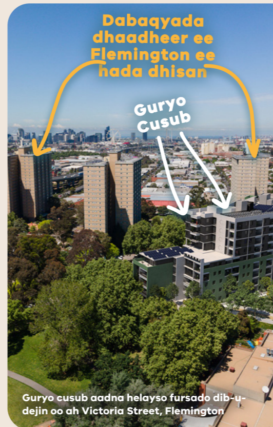
Guryo cusub aadna helayso fursado dib-u-dejin oo ah Victoria Street, Flemington