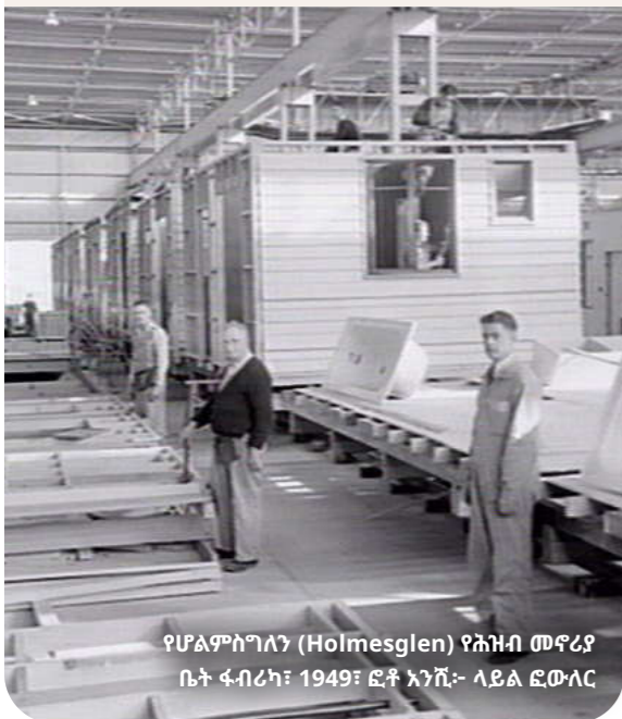
የሆልሜግላን (Holmesglen) የሕዝብ መኖሪያ ቤት ፋብሪካ፣ 1949

በእነዚህ ቦታዎች/ጣቢያዎች ያሉትን ማህበራዊ ቤቶች ቢያንስ በ10 በመቶ እየጨመርን ነው።