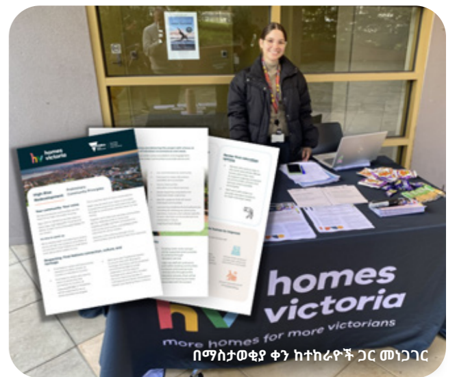
ለሁሉም ሰማይ ጠቀስ ፎቆች ተከራዮች እና ማህበረሰቦች ምርጥ የቤት ውጤቶችን ለማቅረብ ቆርጠናል፣ እና ፕሮግራሙን በሂደት ስናወጣ ማዳመጥ እና መሳተፍ ብሎም መረጃዎች እና ማሻሻያዎች መስጠት እንቀጥላለን።

ክፍለ-ጊዜዎቹ በጥሩ ሁኔታ ሰዎች የተካፈሉባቸው ሲሆን የተለያዩ የተከራይ ጥያቄዎችን እንድናዳምጥ እና እንድንመልስ እና የተከራይ እና የማህበረሰብ ሀሳቦች እና አስተያየቶች ይህንን አስፈላጊ ፕሮጀክት ለመቅረጽ እንዲረዱን ትልቅ እድል ሰጥተናል።