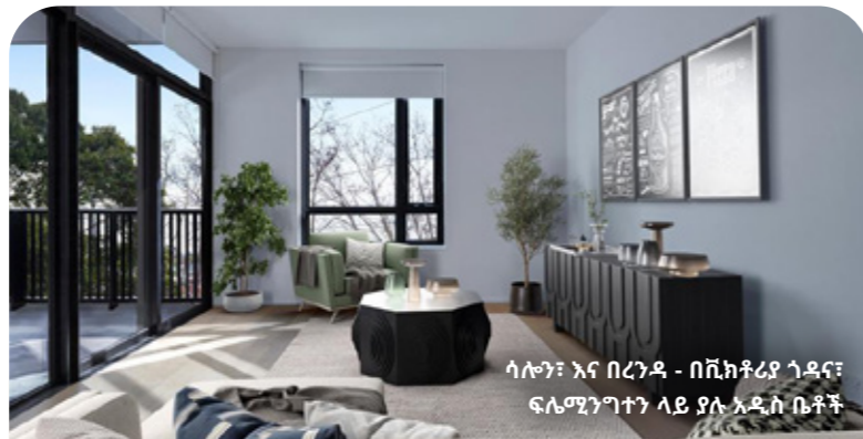
ሳሎን፣ እና በረንዳ - በቪክቶሪያ ሳዳና፣ ፍሌሚንግተን ላይ ያሉ አዲስ ቤቶች

የእኛ ሰማይ ጠቀስ ፎቆች ወደ 70 ለሚጠጉ ዓመታት ጠንካራ ሆነው የቆዩ ቢሆንም አሁን ግን አገልግሎታቸው ወደ ማብቂያው እየተቃረቡ ነው። 44ቱ ማማዎች የተገነቡት ጊዜ ባለፈባቸው የሙቀት ምቹት፣ የዘላቂነት፣ የድምፅ መከላከያ፣ የአየር መተንፈሻ እና የተደራሽነት ደረጃዎች ነው። ጠለቅ ያለ ግምገማ ለተደራገም በኋላ፣ ማማዎቹ ለአድሳት ተስማሚ እንዳልሆኑ ደርሰዋል።