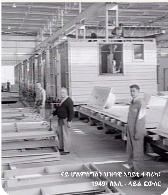
ናይ ሆልምስግላን ህዝባዊ ኣባይቲ ፋብሪካ፣ 1949፣ ሰኢሊ - ላይል ደውላር

ኣብዚ ጣቢያታት እዚ ቍጽሪ ማሕበራዊ ኣባይቲ እንተ ወሓደ ብ10 ሚእታዊ ንውስኽ ኣሎና፡፡