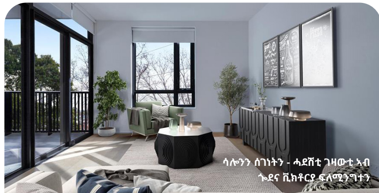
ሳሎን ሰገነት - ሓደሽቲ ገዛውቲ ኣብ ጉድና ቪክቶሪያ ፍለሚንግተን

እቲ ነዋሕቲ ፓላሶታት ዳርጋ ን70 ዓመት እኳ ጸኒቡ ጠጠው እንተበለ፣ አብዚ እዋን እዚ ግና ናብ መወዳእታ ስርሑ ይቐርብ ኣሎ፡፡ እቲ 44 ነዋሕቲ ፓላሶታት ግዜኡ ዝሓለፎ መዕቀቢታት ናይ ምወቕ ምኛት፣ ቀዋሚነት፣ ናይ ድምጺ መከላኸሊ መሳርሒ፣ ምዘዋር ኣየር ከምኡውን ብቐሊሉ ዘይእቶ ኩይት ኢዩ ተሃኒጹ፡፡ ድሕሪ ገምጋም እቲ ፓላሶታት ንጽገና ዝበቐዕ ኩይት ኣይረኽብናን፡፡