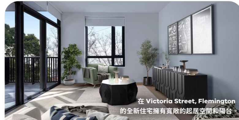
在 Victoria Street, Flemington 的全新住宅擁有寬敞的起居空間和陽台。

我們的高層建築已經屹立了近 70 年，但現在已接近它們的使用壽命。44 棟高層建築的保暖舒適性、永續性、隔音、通風和無障礙通道等方面所採用的建造標準已經過時了。經過深思熟慮的審查，我們認為這些高層建築不適合進行翻修。