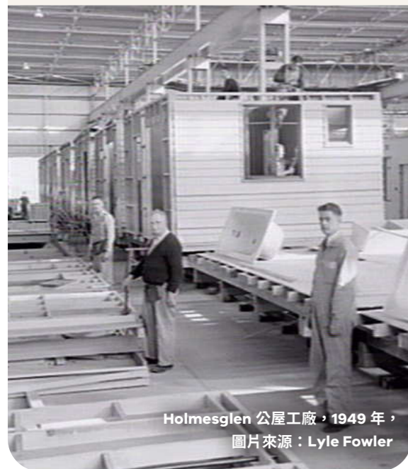
Holmesglen 公屋工廠，1949 年， 圖片來源：Lyle Fowler