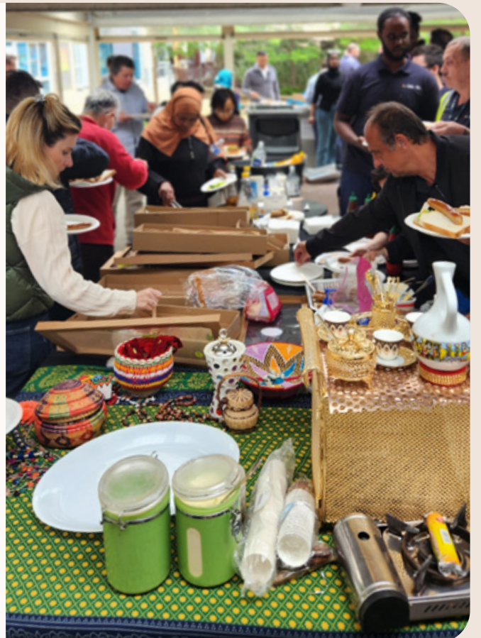
ብኣንጻሩ- ተኻሪይቲ ነቲ ኣብ ኖርዝ መልበርን ዝተገብረ ናይ ማሕበረሰብ ባርቢኪው የስተማኛርዎ

ከም ክፍሊ ናይቲ ፓቪንግ ዘ ቈይ ፎርዋርድ ዝበሃል ተበግሶ ኩይኑ ኣብ መውዳእታ ናይ ዝሓለፈ ዓመት ምስ ናይ ኖርዝ መልበርን ቋንቋን ትምህርቲን ብምትሕብባር ናይ ማሕበረሰብ ባርቢኪው ተገይሩ። እዚ ኣጋጣሚ እዚ ነበርቲ ኖርዝ መልበርን ፍለሚንግቶንን ምስ ኡረባብቶምን ምስ ኣቕረብቲ ኣገልግሎት ማሕበረሰብን ንምርኻብ ኣጋጣሚ ፈጠሩ። ኣብ ርእሲ እቲ ጽቡቕ ኩነታት ኣየር ብዙሓት ተቐማጦን ኣቕረብቲ ኣገልግሎትን በቲ ዝድነኹ ምግብን ቡንን እናተሓኩሱ ንማሕበረሰብ ብሓባር ዝድግፉሉ መገድታት ተመደዩጦም።