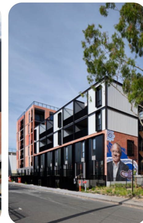
Bangs Street, Prahran