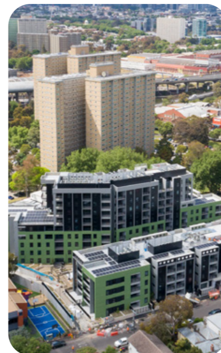
Victoria Street, Flemington