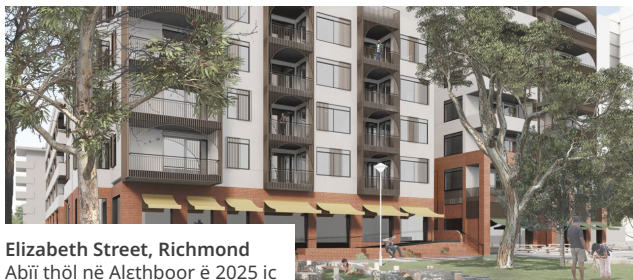
Elizabeth Street, Richmond Abii thöl në Alethboor ë 2025 ic