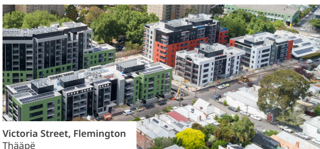
Victoria Street, Flemington Thääpë